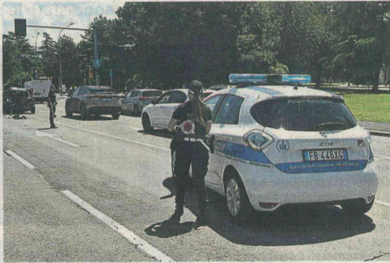
In via Porrettana sono intervenuti polizia locale e sanitari del 118, per soccorrere il centauro rimasto gravemente ferito domenica pomeriggio

Stando a quanto ricostruito dalla polizia locale, intervenuta assieme ai sanitari del 118, il sessantasettenne, che percorreva via Porrettana in direzione peri-