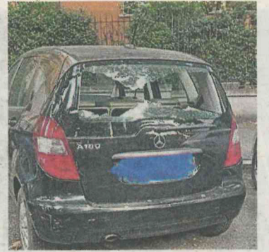
Via Laura Bassi